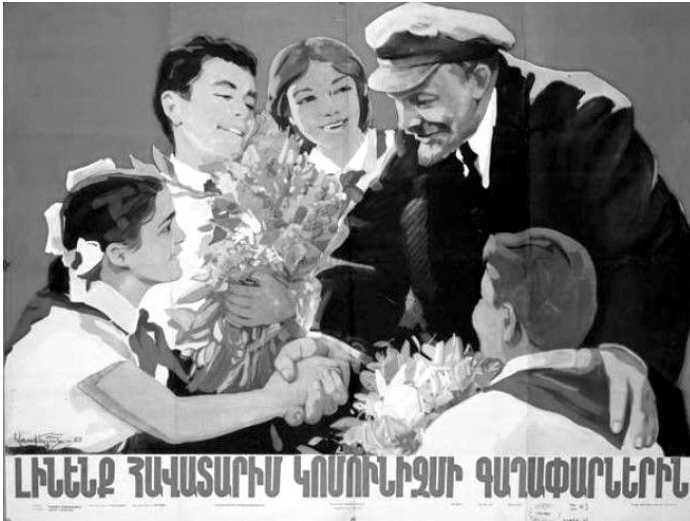
Resim 2: "Çocuklar" Konulu Propaganda Posterleri

"Çocuklar" konulu propaganda posterleri, 1962 yılında Gevork Arakelian tarafından hazırlanmıştır. Sözdizimsel boyutta analiz edildiğinde posterde Lenin'in çocuklar ile iç içe olduğu görülmektedir. Çocukların üzerinde okul üniformalarının olduğu ve Lenin'e çiçek sundukları yansıtılmaktadır. Posterde hem Lenin'in hem de çocukların gülümsediği, Lenin'in bir eliyle çocuklardan birinin elini sıkıdığı, diğer eliyle de çocuklardan birinin omzuna dokunduğu aktarılmaktadır. Posterin fonunun çalışma kapsamında incelenen ilk posterde olduğu kırmızı olduğu görülmektedir. Posterin altında Komünizm'in fikirlerine sadık kalalım (Լիեննի հավատարիմ կունունիզմի գաղափարներին) yazısına yer verilmektedir.