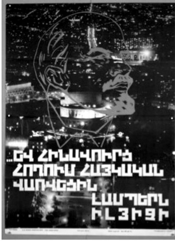
Resim 5: “Aydınlık” Konulu Propaganda Posteri

Anlambilimsel boyutta analiz edildiğinde posterde Lenin liderliğinde ESSC'nin gelişmiş bir ülke haline geldiği mesajı verilmektedir. Bu süreçte Erivan'ın ışıklar içerisinde gösterilmesi ve posterin merkezine Lenin'in resminin konumlandırılması ile ESSC'de yaşanan gelişmelerin temelinde Lenin olduğu vurgusu yapılmaktadır. Posterde eski Ermenistan olarak Komünizm ideolojisinin Ermenistan'a hakim olmadığı dönemlere vurgu yapılmakta ve Lenin liderliğinde Komünizm ideolojisiyle birlikte Ermenistan'da yaşanan teknolojik gelişmeler ön plana çıkarılmaya çalışılmaktadır. Edimbilimsel boyutta incelendiğinde posterde Ermeni halkının ESSC'de yaşanan gelişmelerden dolayı Lenin'e minnet duyması gerektiğine yönelik çıkarım ortaya konulmaktadır.