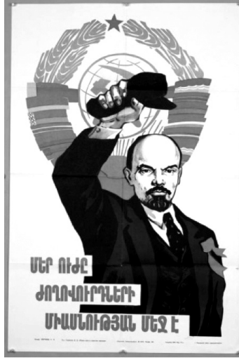
Resim 3: “Birlik” Konulu Propaganda Posterleri

Anlambilimsel boyutta analiz edildiğinde posterdeki görsel ve yazılı kodlar bir arada okunduğunda, Sovyetler Birliği’ni oluşturan ülkelerin birliğinin Lenin üzerinden somutlandığı ortaya çıkmaktadır. Posterde Lenin üzerinden birlik mesajının verildiği ve Komünizm’in güçlü ve etkili olabilmesinde birliğin önemli olduğu vurgulanmaktadır. Edibilimsel boyutta incelendiğinde posterde Komünizm ideolojisinin güçlü olabilmesi için Komünizm ile yönetilen ülkelerin Lenin’in öğretileri doğrultusunda birlik olması gerektiği çıkarımı ortaya konulmaktadır.