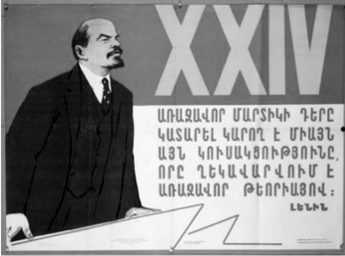
Resim 8: “Parti” Konulu Propaganda Posterleri