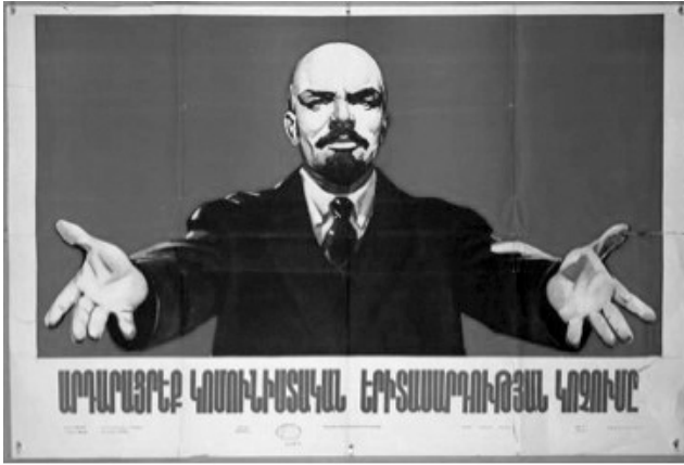
Resim 1: “Komünist Gençlik” Konulu Propaganda Posterini (Kaynak: IDEP, 2020a)

“Komünist Gençlik” konulu propaganda posterini, 1958 yılında Gevork Arakelian tarafından hazırlanmıştır. Sözdizimsel boyutta incelendiğinde posterde kırmızı bir fonda Lenin’in iki elini açarak posterini izleyenlere doğru baktığı görülmektedir. Posterin altında Komünist gençliğe uygun yaşayın (Արդարացրէք կոմունիստական երիտասարդության կոչումը) yazısına yer verilmektedir.