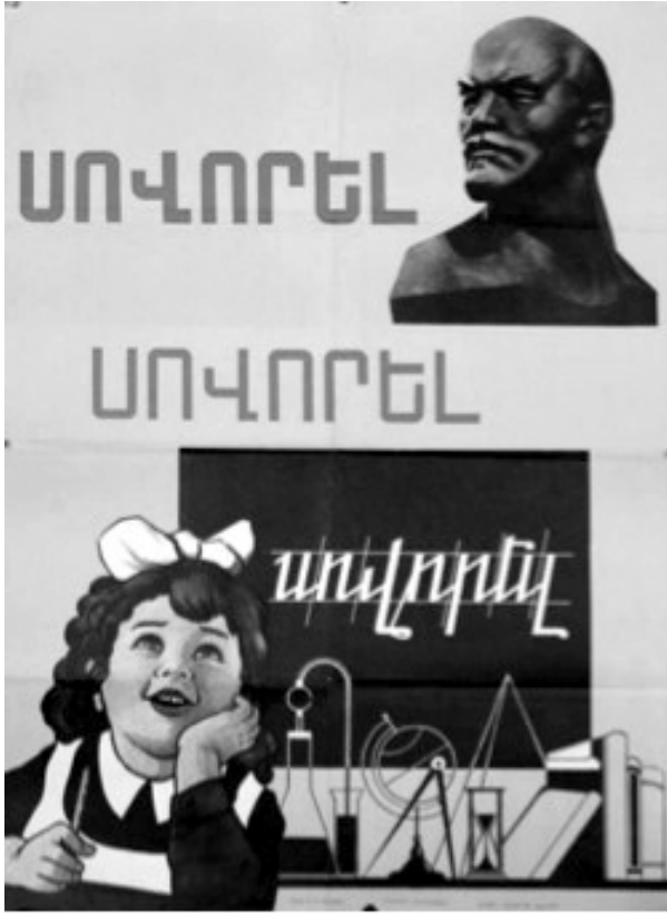
Resim 4: “Eğitim” Konulu Propaganda Posterleri

“Eğitim” konulu propaganda posterleri, 1970 yılında Sergei Aveti Arutchyan tarafından hazırlanmıştır. Sözdizimsel boyutta analiz edildiğinde posterin sol üstünde Lenin’e ait bir büst görseline ve sağ altında ise bir kız öğrencinin görseline yer verildiği görülmektedir. Öğrencinin bir elini başına koyarak Lenin’i düşündüğü, diğer eliyle de kalem tuttuğu yansıtılmaktadır. Öğrencinin arkasında yazı tahtası ve okul materyallerinin olduğu görülmektedir. Posterde büyük puntolarda yukarıdan aşağıya doğru Öğren, Öğren, Öğren... (Սովորել, սովորել, սովորել...) yazısına yer verilmektedir.