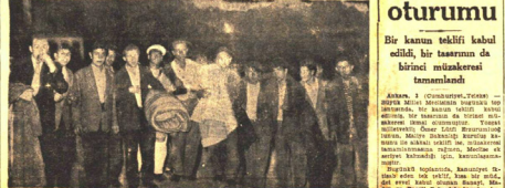
Batı Trakya Cemaat İdare Heyetleri

Maras C.H.P. il kongresi hâdiseli geçti İl kongresi Maras'ta yapıldı. Kongrede Halk Partisi'nin Batı Trakya'da cemaat idare heyetleri seçildi. Bu heyetlerin kurulması, Yunanlar tarafından Batı Trakya'da cemaat idare heyetleri seçildi.