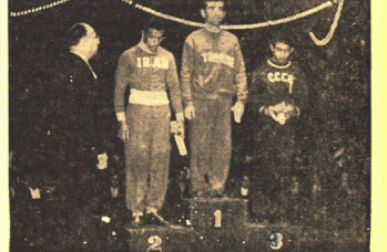
Dünya Şampiyonluk Kazananları

Ferdi tasnifte Kartal, Akbaş, Dağıstanlı ve Kaplan dünya birinciliğini kazandılar