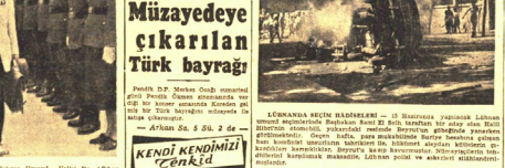
Türk Bayrağı Müzayedeye Çıkarıldı

Müzayedeye çıkarılan Türk bayrağı Müzayedeye çıkarılan Türk bayrağı. Müzayedeye çıkarılan Türk bayrağı.