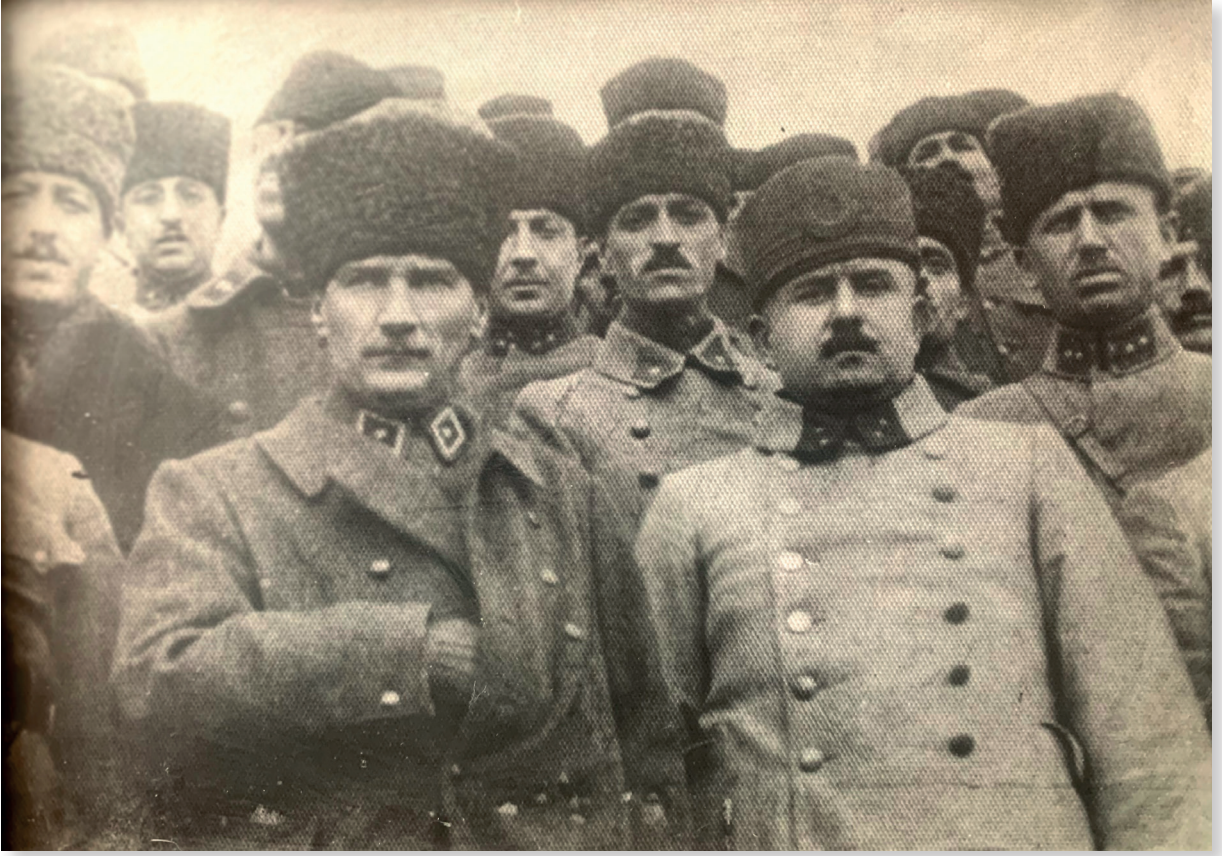
3 Temmuz 1919, Mustafa Kemal'in Erzurum'da karşılanması.

9 Temmuz günü 3. Ordu Müfettişliği'ne Mustafa Kemal'in yerine vekâleten atanan Karabekir Paşa, bu kere de Erzurum'daki İtilaf Devletleri askeri kontrol heyetinin kongreyi engelleme girişimleriyle karşılaşmaktadır. Kontrol Heyeti başkanı İngiliz Yarbay Rawlinson'un 9 Temmuz günü Mustafa Kemal'i ziyaretinde, Kongre'nin yapılması durumunda silahlı müdahale tehdidi içeren sözlerinin sert karşılık bulmasıyla İngiliz Yarbay görüşmeden ayrılacaktır.