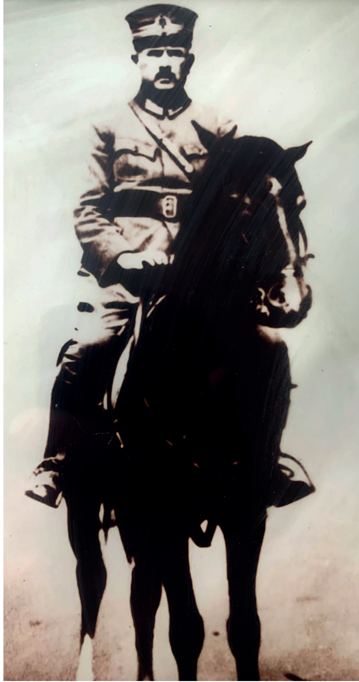
Nisan 1915, Kafkas Kolordu Komutanı.

Doğu Anadolu'daki görevi Mondros ile sona erdirilmiş olan Karabekir Paşa ise Trabzon üstünden