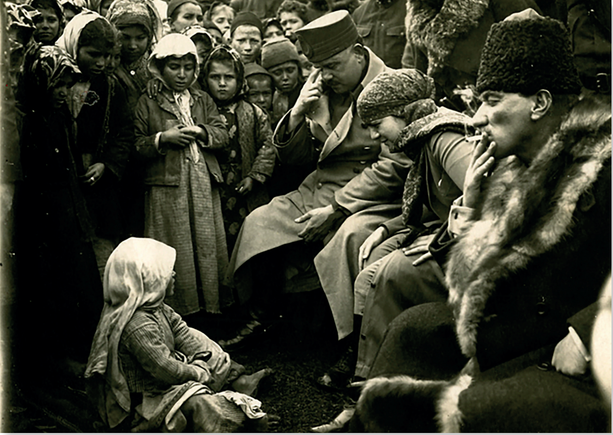
Mart - Nisan 1917 (Muhtemelen), Ermeni mezalimi yetimleriyle. Kazım Karabekir, Latife Hanım ve Mustafa Kemal Atatürk (Kazım Karabekir gözyaşlarını siliyor).

ayında Erzincan düşer. Osmanlı 3. Ordusu büyük kayıplar vermektedir. 27 Mart 1916'da 16. Kolordu Komutanlığına atanarak Diyarbakır'da göreve başlamış olan Mustafa Kemal'in orduyu toparlama çalışmaları sonunda Muş geri alınır, Bitlis de kısa süreliğine Osmanlı kontrolüne geçer. Ancak bu münferit başarılar cephenin büyük ölçüde kaybını, sivil katliamı ve bölgeden toplu göçleri önleyememektedir.