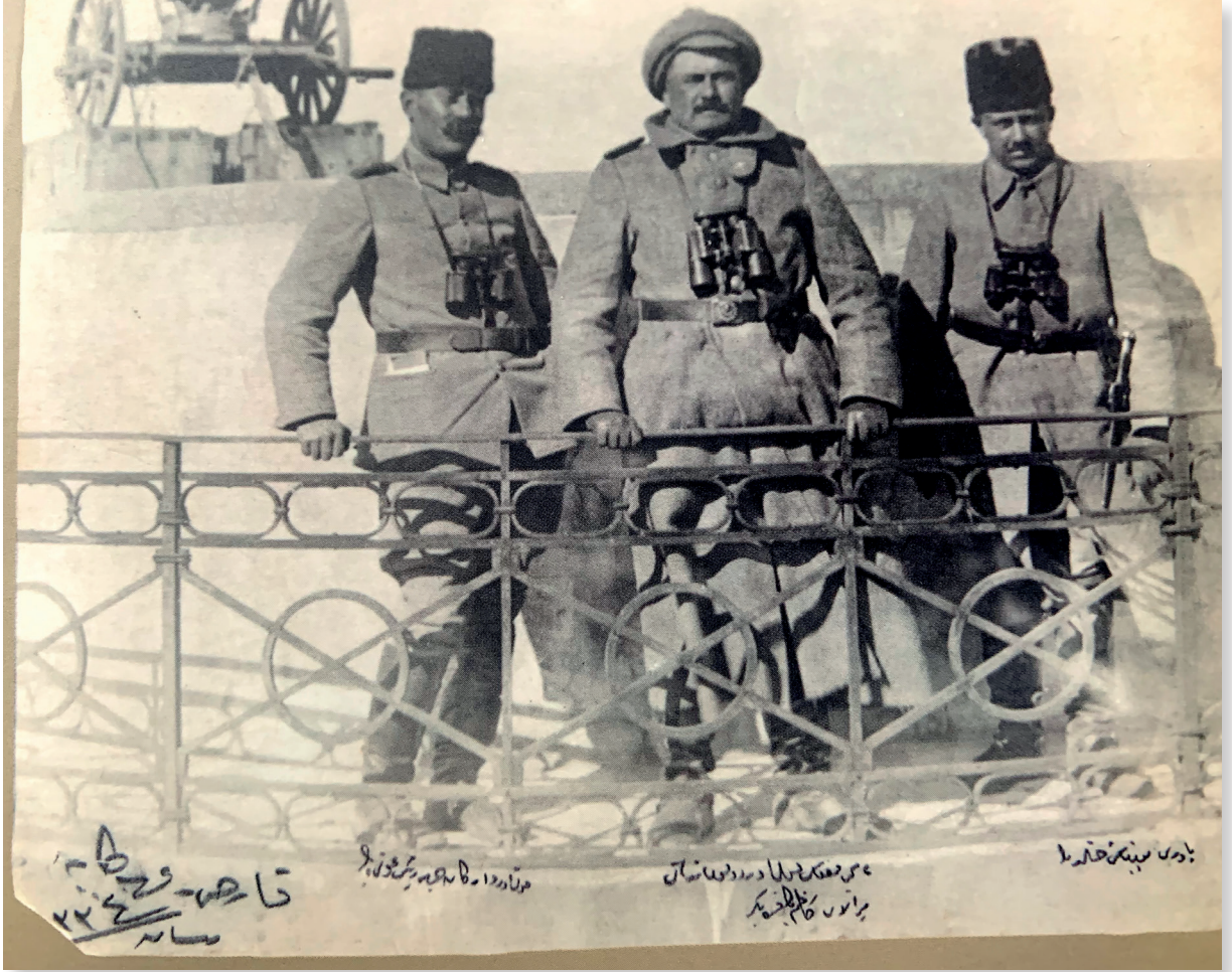
24 Nisan 1918 Kars'ın geri alınışı, Kars kapısında sağdaki Yaver Yüzbaşı Halit bey, ortadaki Kafkas Kolordu Kumandanı Miralay Kazım Karabekir, soldaki Erkan-ı Harp Reisi Avni bey.

Karabekir'in Kafkasya içlerine ilerleyiş hazırlığı sürerken yeni bir gelişme olacaktır: Ordu Komutanlığı'ndan alınan 1 ve 4 Haziran günlü talimatlarla Batum müzakerelerinde 4 Haziran günü Gürcü ve Ermeni taraflarıyla barış için mutabakat sağlandığı, barışın uygulama şartlarının ayrıca müzakere edileceği, Ermeni ve Gürcülerin bu kez Alman himayesine girdiğinin de anlaşıldığı, bu şartlarda Erivan ve Tiflis üzerine ileri harekâtın şimdilik durdurulması emredilmektedir. Osmanlı Hükûmeti Batum'da 4 Haziran günü Gürcü Hükûmetiyle, 11 Haziran'da da Ermeni ve Azerbaycanlı Hükûmetleriyle barış antlaşmaları imzalamıştır. Osmanlı ordularının Doğu Anadolu'da ilerleyişinin baskısı altında imzalanan bu antlaşmalardan Azerbaycan Hükûmeti ile olanına yukarıda değinilmişti. Gürcü Hükûmeti ile yapılan antlaşmada ise Batum Şehri ve Sancağı yanında Ahıska ve Ahılkelek Nahiyelerinin de Osmanlı sınırları içinde kalmasıyla Brest-Litovsk sınırları da aşılmış,