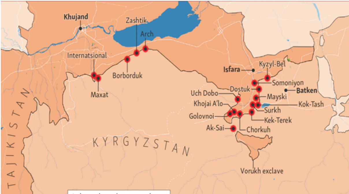
Resim: Tartışmalı Alanlar [21]

1991 senesinde Rahman Nabiyev yönetimindeki Tacikistan, Kırgızistan Hükümetinden ayrı ayrı 10 bölgeden belirli alanlar üzerindeki toprakları istemiştir. Bu taleplerin ardından Kırgızistan Devlet Başkanı, Tacikistan Devlet Başkanını haksız iddialarından ve olayları tırmandırmaktan dolayı suçlamıştır. Karşılıklı yapılan açıklamalar ile Tacikistan ve Kırgızistan arasında siyasi bir kriz yaşanmıştır. Tacikistanın, Kırgızistandan toprak talebi Devlet Başkanı İmamali Rahman döneminde de devam etmiştir. Tartışmalı alanlar üzerindeki Tacik-Kırgız yerleşim yerleri, iki ülke halkı arasında sorunlar yaratmaktadır. Bölgedeki başlıca tartışmalı alanlar Vorukh, Kök-Taş, Kek-Terek, Ak-Sai, Orto-Boz, Kara-Bak, Somonion, Lyangar, Maksat ve Dostuk köyleridir.[20]